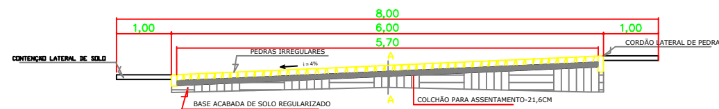
SEÇÃO TRANSVERSAL EM CURVA SEM ESCALA: