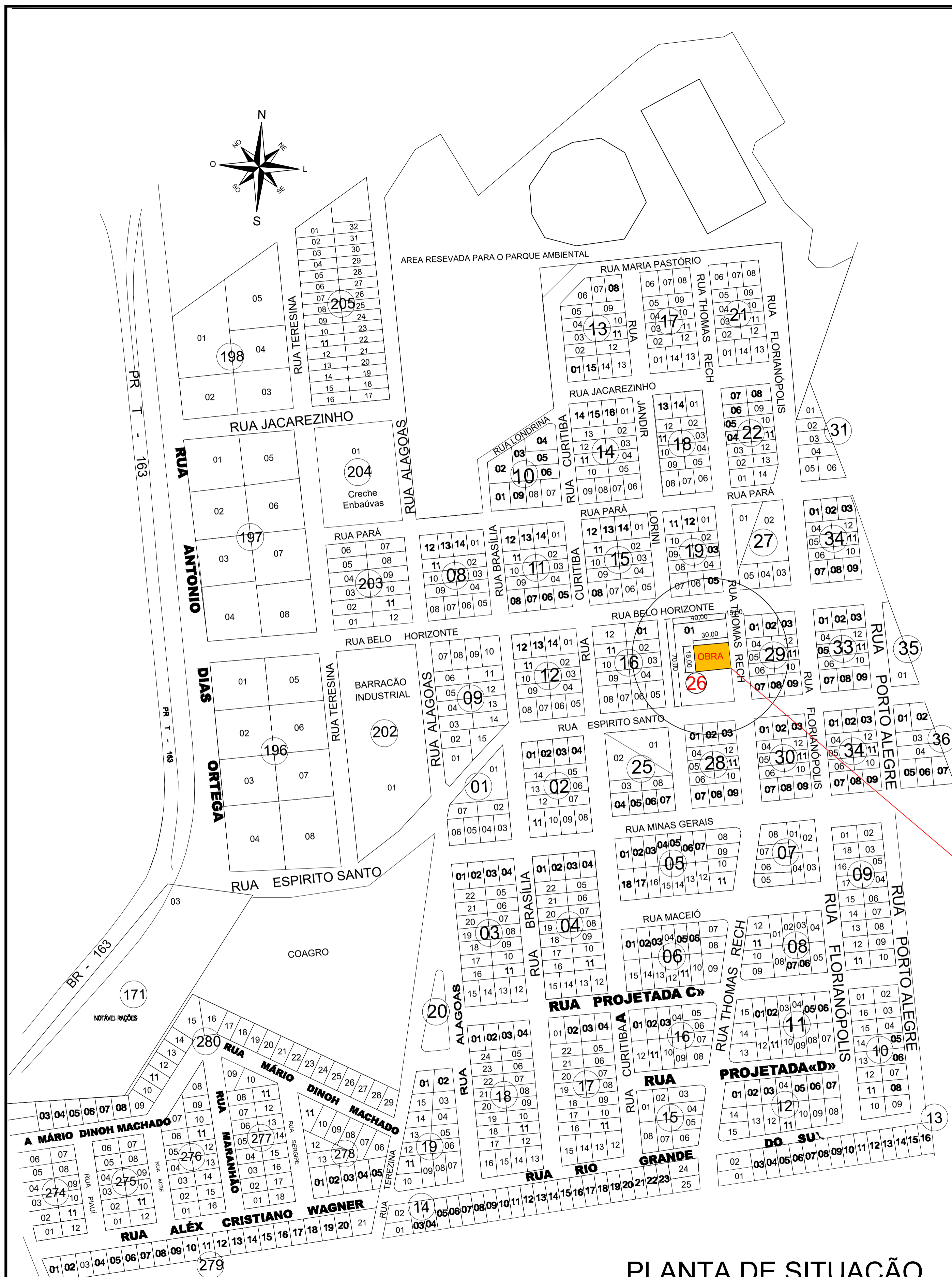
PLANTA DE SITUAÇÃO ESCALA - 1:1000