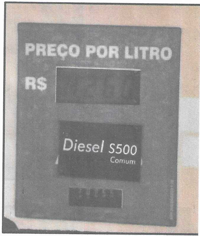
Figura 4 - BOMBA DE COMBUSTIVEL POSTO PANDA