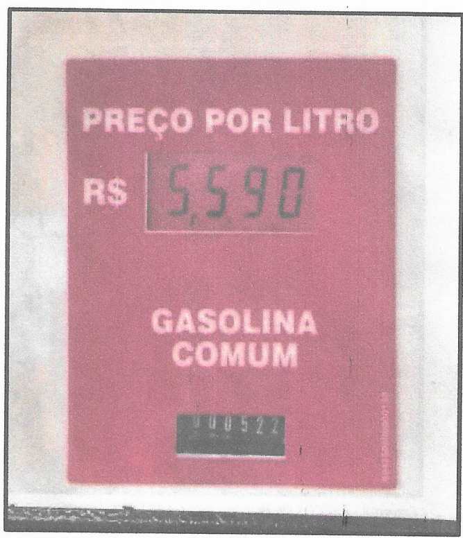
Figura 6 - BOMBA DE COMBUSTIVEL POSTO PANDA