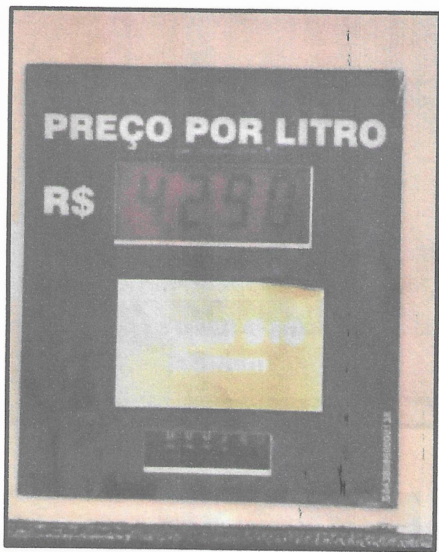
Figura 5 - BOMBA DE COMBUSTIVEL POSTO PANDA