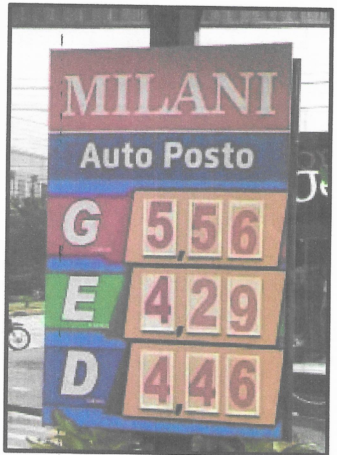
Figura 2 - PREÇOS DE BOMBA POSTO MILANI